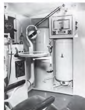
Mobile Medizin von ZEPPELIN anno 1950